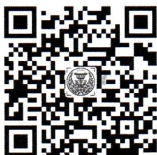
แบนเนอร์ประชาสัมพันธ์ แอปพลิเคชันจันทรา